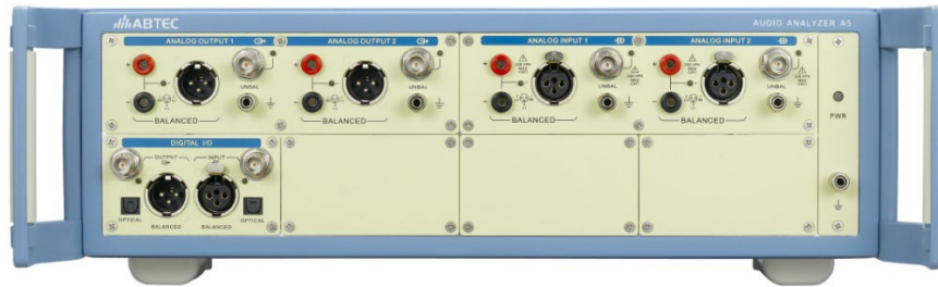
图表 7 音频分析仪 A5

北京度纬科技有限公司销售的 A5 音频分析仪，是一款具备高性能、多接口类型、多测试功能于一体的专业音频分析仪。支持一系列测试插件拓展，支持各种数字音频接口 (BT/I 2 S/HDMI/PDM 等)，是消费类音频和汽车电子等音视频产品研发阶段的首选测试设备。