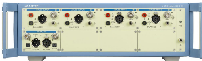
图表 7 音频分析仪 A5

北京度纬科技有限公司销售的 A5 音频分析仪，是一款具备高性能、多接口类型、多测试功能于一体的专业音频分析仪。支持一系列测试插件拓展，支持各种数字音频接口（BT/I 2 S/HDMI/PDM 等），是消费类音频和汽车电子等音视频产品研发阶段的首选测试设备。