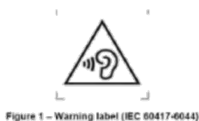
图 3 安全提示标志