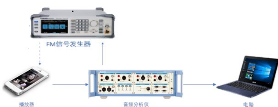
图 5 播放器测试连接图