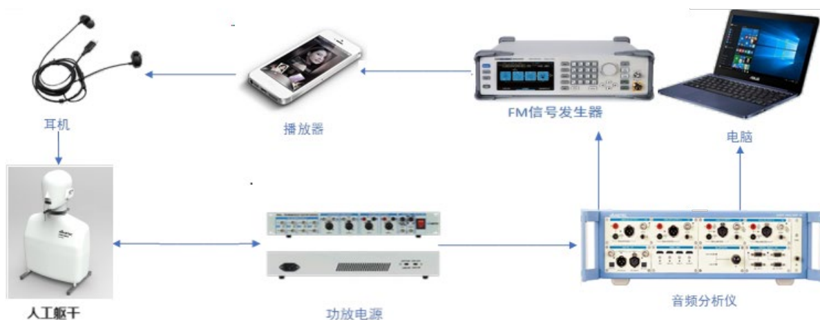
图 4 整机测试连接图

说明： 测试系统主要包括：音频分析仪、功放电源、人工躯干、控制电脑和被测耳机及播放器，信号发生器。